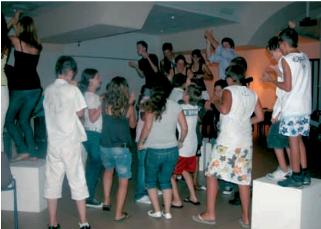
■ Ci-contre : soirée "tapis rouge"