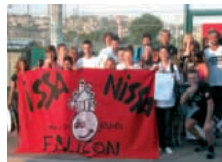
■ Ci-dessous : les jeunes de Falicon à la séance d'entraînement de l'OCC Nice