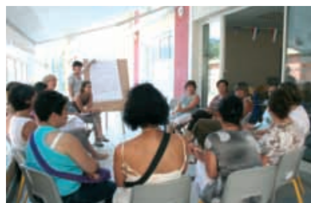
■ Ci-contre : journée de formation du personnel Petite Enfance au siège du Sivom