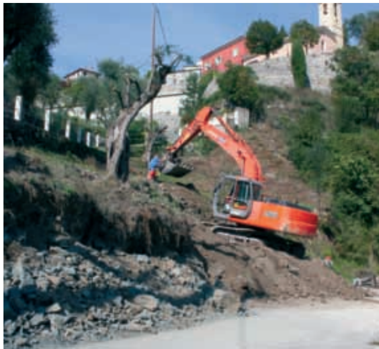
■ Ci-contre : la rue général Tordo, à Tourrette-Levens, aujourd'hui terminée, l'élargissement de la voie d'accès à la mairie de Duranus, en cours.