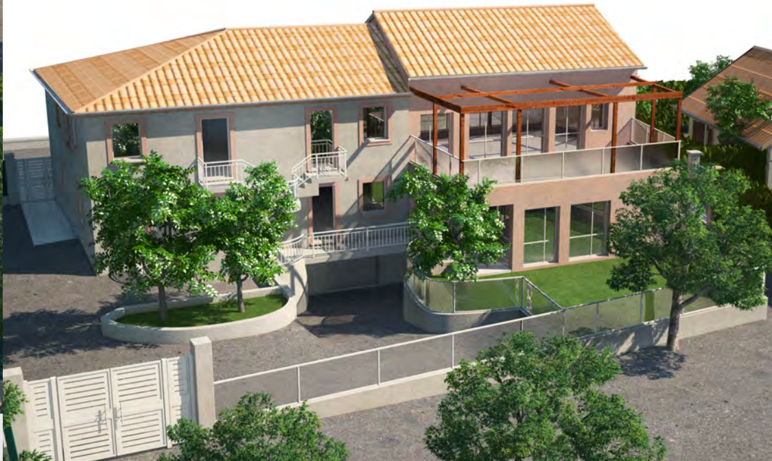
Un oasis de verdure attend nos petits côté cour