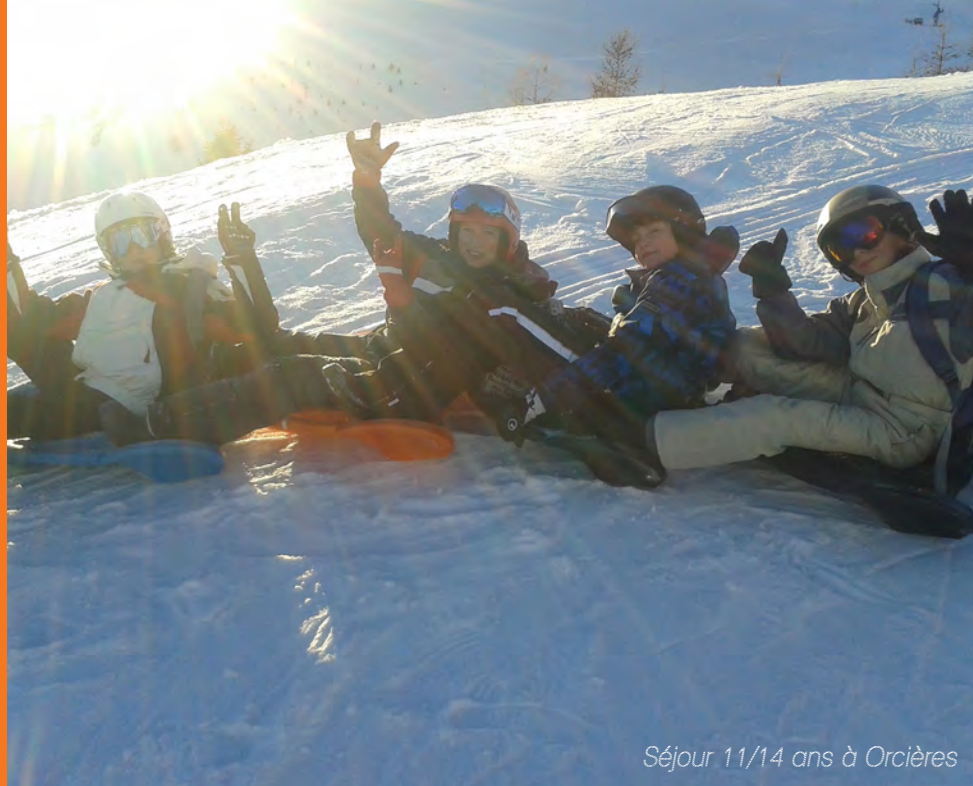
Séjour 11/14 ans à Orcières