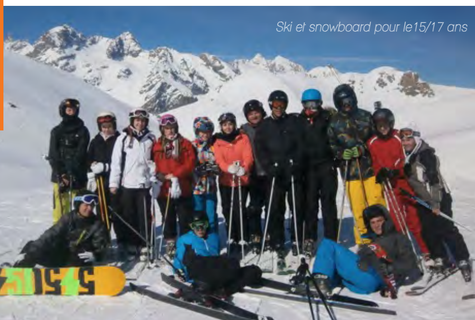
Ski et snowboard pour le 15/17 ans