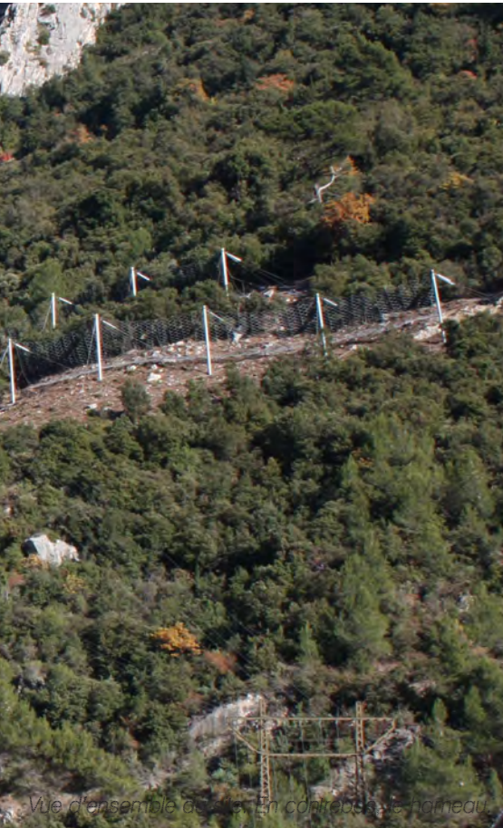
Vue d'ensemble du site. En contrebas, le hameau.