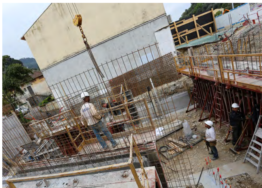
Les fondations du chantier avancent à grands pas

Alors que les travaux d'élargissement du boulevard du 8 mai 1945 touchent à leur fin, un nouveau chantier se met en place sur ce même boulevard. L'extension de la crèche intercommunale.