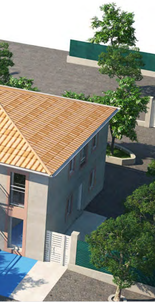
La future entrée de la crèche boulevard du 8 mai

Coût du projet : 1 300 000€ Itc Financé par la Caisse d'Allocations Familiales, la Région (qui a subventionné l'acquisition foncière) la Métropole, le Conseil Général et la commune