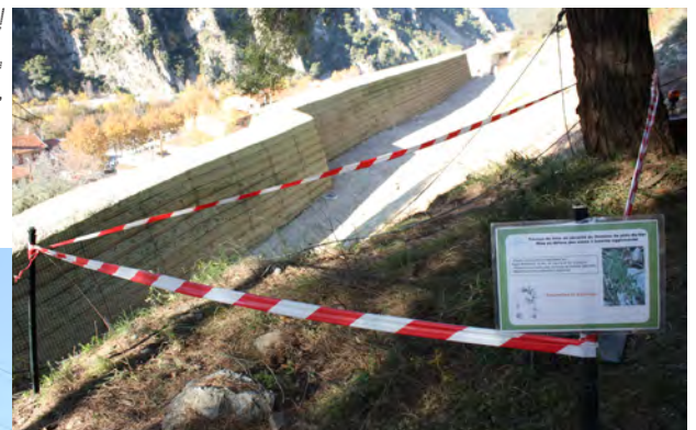
Attention Luzerne ! En arrière plan, le merlon.

Coût du projet : 2 200 000€ ITC Financé par l'État, le Conseil Général, le Conseil Régional et la Commune