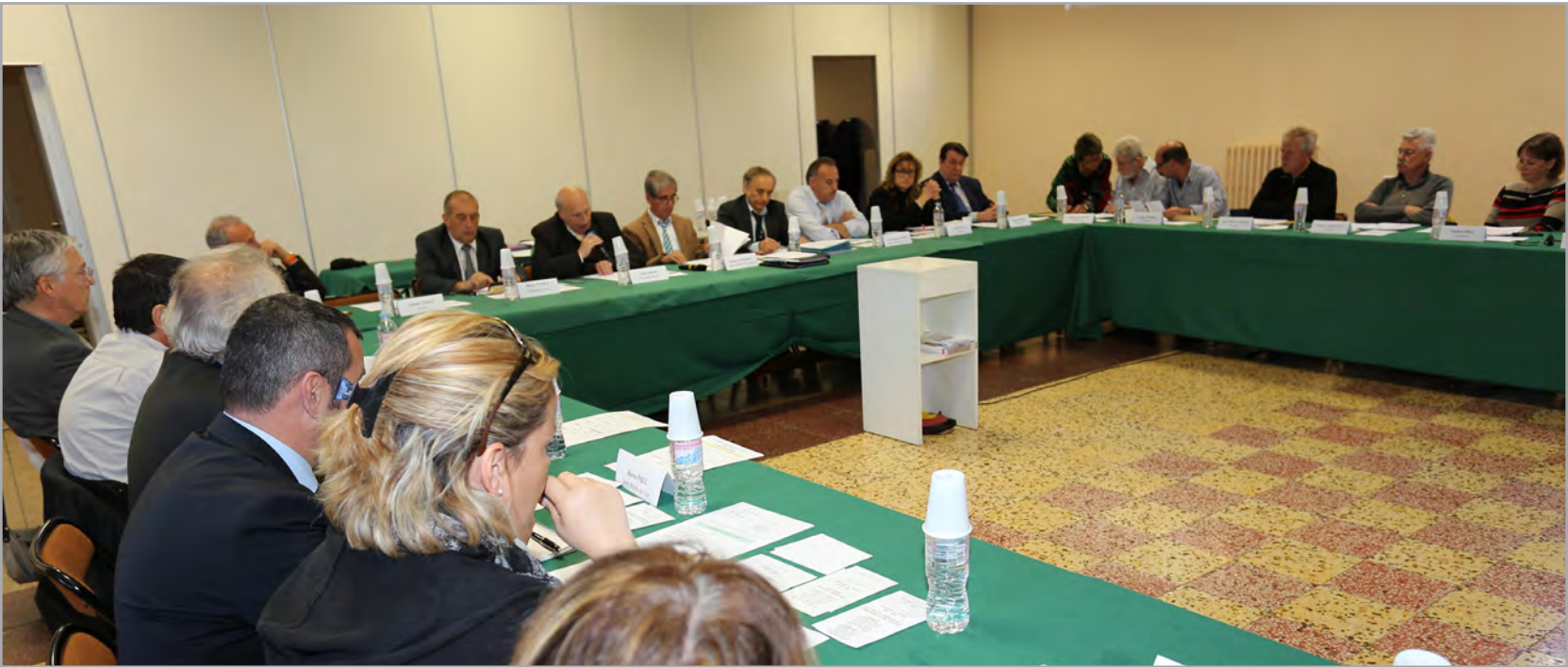
Première réunion du nouveau Comité du SIVoM Val de Banquière.